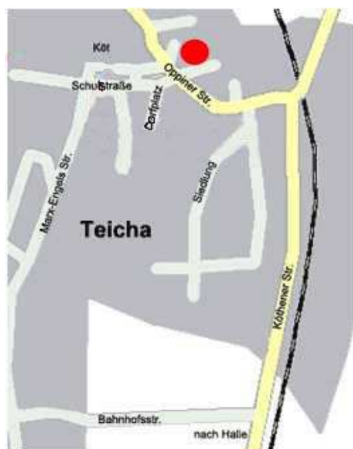
Abbildung 3: Teicha