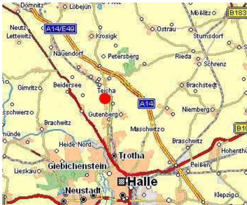
Abbildung 2: Halle, Trotha, Gutenberg, Teicha